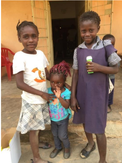
Barn vi träffade när vi var i en by och undervisade i näringsrik kost för barn.