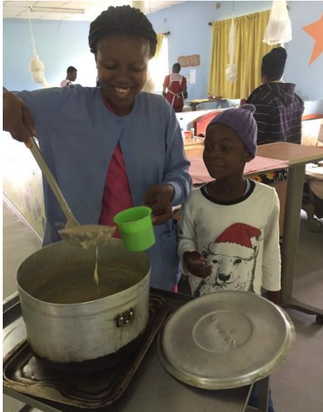
Frukost på sjukhuset.