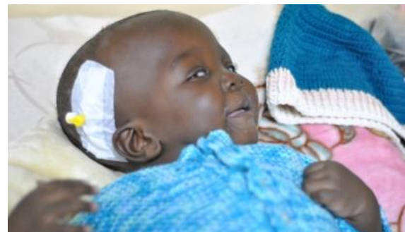
Tack Inner Wheel i Älmhult!